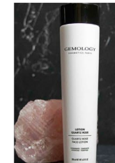
LOTION QUARTZ ROSE - hydratante, tonifiante