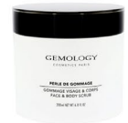
PERLE DE GOMMAGE - Gommage visage et corps